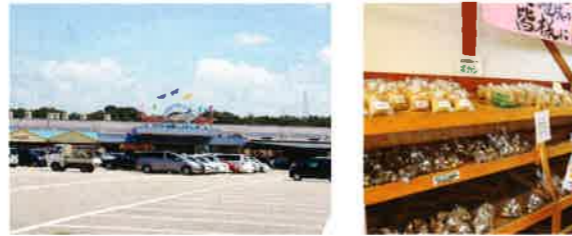
穫れたて野菜が安いAコープ 紀伊富田駅に近いAコープの一角では、会員農家の穫れたて野菜や加工品などが安い。

を占める。したがって中古物件購入の場合も、その多くは更新料が不要である。使用料は月額数千円が一般的だが、高いところでは月額4万円もある。海辺の中古マンションは、白浜町のほか、隣の田辺市新庄町にもある。相場は100万円台〜800万円。海の眺望はもちろん温泉大浴場付きだ。1DKか2DKタイプに格安が多く、けっこう流通している。近畿圏のシニア層の購入が多い。修繕積立金を含めた管理費は月額2万〜3万円が主流。なお、中古マンションの賃貸は月額4万円台が中心となっている。