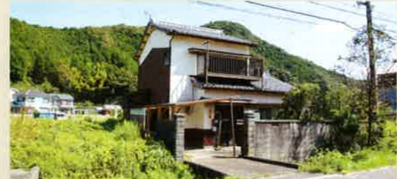
↑紀勢本線白浜駅から東側は農村風景のなかに住宅地が広がり静かな環境だ。●物件は未登記で築年数不詳。未登記建物付きの売地としての取引。屋根の一部を補修。