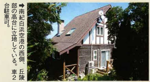
南紀白浜空港の西側、丘陵部の高台に立地している。車2台駐車可。