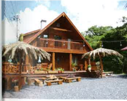
ログハウスカフェ「ペトラの里」◎和歌山県西牟婁郡白浜町2927-1790 ☎0739-43-6848 http://www.geocities.jp/petranosato/

右ノオーガニックコーヒー(500円)。美濃焼伝統工芸士によるオリジナルカップ使用。左ノ敷地内に足湯を設置。足湯に浸かりながらコーヒータイムもOK。